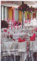
la transparence des chaises

Duo de roses Comme les nappes blanches, les serviettes sont ornées de simples rubans de satin coloré. Les nuances alternent pour ne pas lasser le regard.