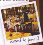
avant le jour J