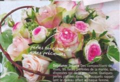
perles au cœur de roses précieuses

Déjeuner intime Des compositions de roses, les fleurs préférées de la mariée, sont disposées sur de la porcelaine. Quelques perles pigées dans les bouquets rappellent le cadeau offert à chaque femme.