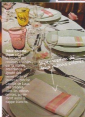
Table chromatique Afin de respecter les couleurs choisies par la mariée, nous avons opté pour des tonalités roses et jaunes, comme Camille de Luca. Des oranges, dans les mêmes teintes, parsèment aussi la nappe blanche.