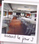
avant le jour J